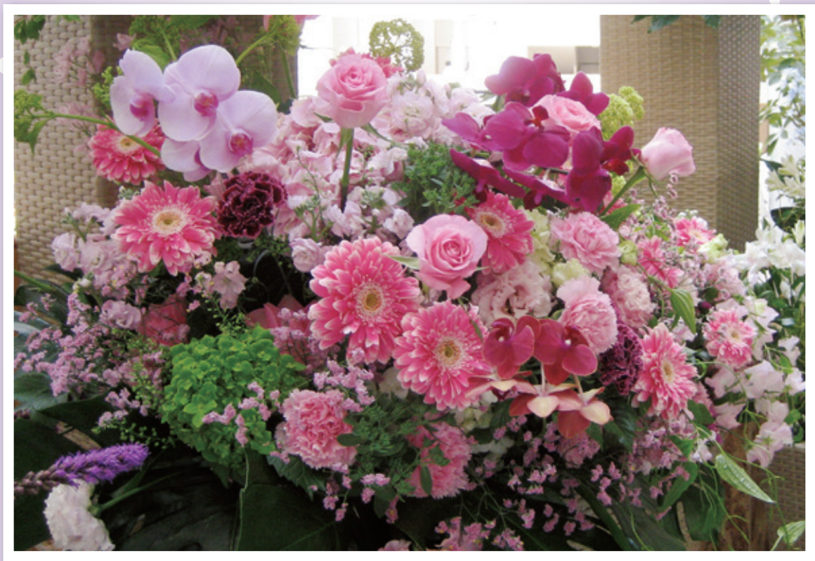
院内に生花の潤い (5月19日撮影)