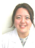
（東5・西5病棟担当） 長野MSW