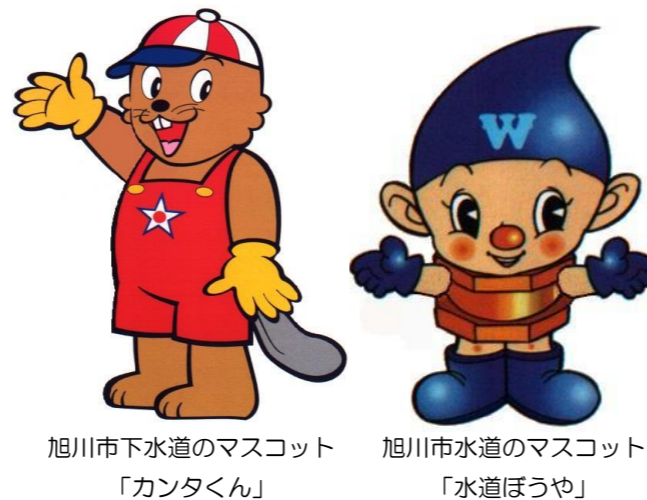
旭川市下水道のマスコット 「カンタくん」