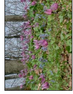
③(早か 春たくりの花 4と5月)