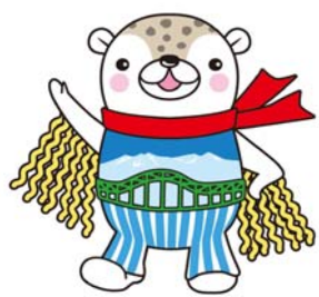
旭川市シンボルキャラクター 「あさっぴー」