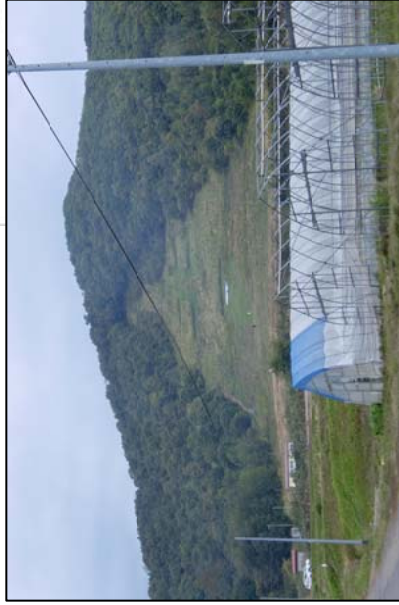
①鬼斗牛山 7線道路に続くパラマロードを抜ける鬼斗牛山展望台からは、360度の大パラマが見られます。