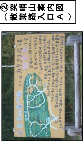
②(突哨山案内図 (散策路入口A))