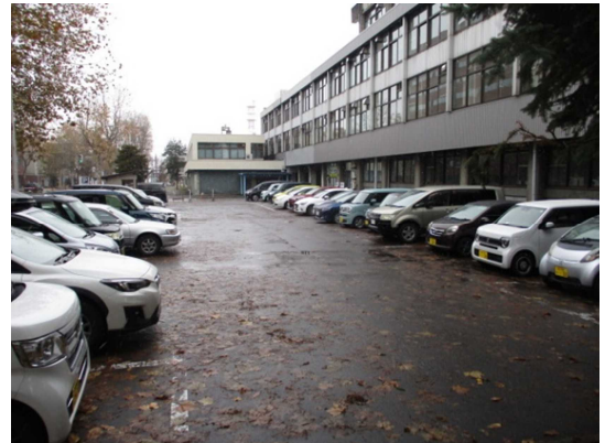
満車状態となっている 土日祝日の第三庁舎表駐車場の様子

今後、令和9年夏頃に第三庁舎跡地に約230台分の駐車場が完成すると、市役所駐車場は合計約370台分の駐車が可能となり、周辺駐車場への影響がさらに懸念され、対策が必要と考えていることや、夜間及び土日祝日には庁舎及び市役所駐車場の維持管理作業が集中的に入り、駐車場の利用制限が必要な状況を踏まえ、令和7年12月の総合庁舎横駐車場の供用開始以降、夜間及び土日祝日は原則閉鎖する取扱いとしています。