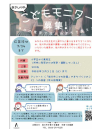
こどもモニター募集チラシ