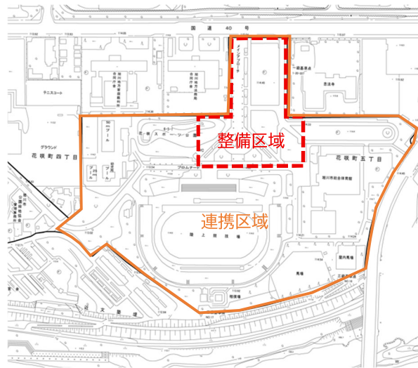
図3 整備区域及び連携区域