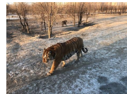
東北虎林園のアムールトラ

2020年は、中国のハルビン（ハルビン）市と旭川市の友好都市提携25周年の年となり、これを記念し、これからも末永く交流が続くことを願うとともに、中国からやって来る多くのお客様をお出迎えする気持ちを込めたイメージでデザインして下さい。