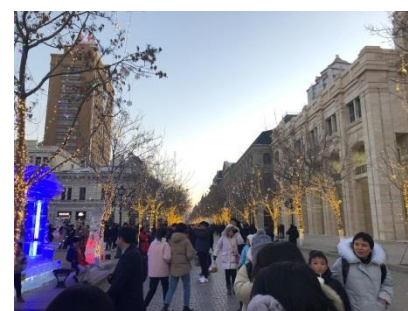
メインストリートの中央大街