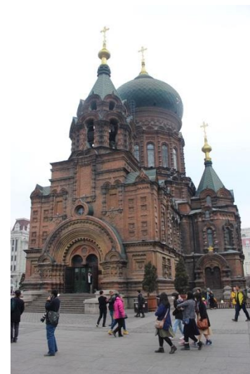
ハルビン市のシンボル 聖ソフィア大聖堂