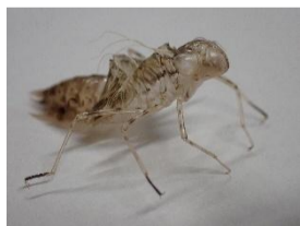
【ヨコ9】ウスバキトンボの「〇〇」の抜け殻。昨年夏、あざらし館で発見されました。