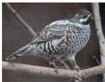
【ヨコ24】の鳥。尾はキジのように長くありません。

24. 「エゾ〇〇〇〇」の羽毛は冬になっても白くなりません。キジの仲間て森林に生息しています。北海道産動物舎で観察できますよ!