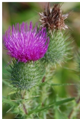
【タテ8】別名「トゲグサ」とも言う葉や花びらの下にトゲがある植物。