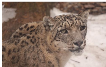
【タテ17】旭山動物園生まれのユキヒョウのメス「ユリ」との繁殖が期待されるオスの「〇〇」。