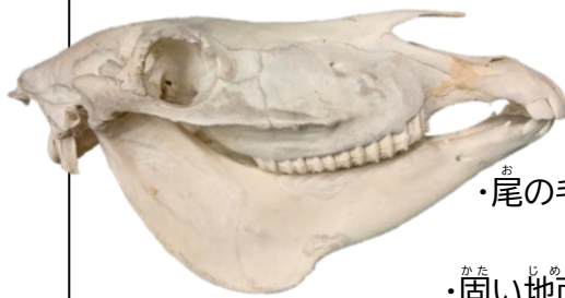
「ヤマシマウマ」の頭骨(動物資料展示館)