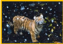
第22回旭山動物園動物ふれあいフォトコンテスト 最優秀賞 作品名:「初めての雪」 名古塵市/荒木浄さんの作品

4/8にアムールトラの2頭(♂と♀)、4/19にはユキヒョウ(♂)、そして6/1にはトナカイ(♀)、6/10・11にはエゾシカ(共に♂)が生まれました。春に産まれた仔たちは、今、初めて雪のある季節を迎えています。彼らは空から降ってくる白い雪、吐く息が白くなるほど冷たい空気をどう感じているのでしょうか? さて、仔たちの様子ですが、アムールトラとユキヒョウの仔は、一般公開された6月には「ネコみたい」と言う方も多かったのですが、もうそんな言葉が出てこないほど猛獣らしくなってきました。6月に産まれたトナカイは、親に比べると体はまだ小さいですがツノも生え、親と離れて行動する時間も増えてきました。エゾシカの仔は共にオスですが、ツノがまだないのでまだ幼さを感じます。仔たちの成長過程を観察しに、ぜひ遊びにきてくださいね。