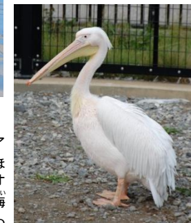
「きりん舎」のモモイロペリカン(写真)。ホロホロチョウも冬期は観覧できません