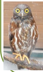
北海道産動物舎のアオバズク(写真)。ほか、コノハズク、オオコノハズク、北海道の野鳥コーナーの一部の鳥も見られなくなります

冬期に観覧できなくなる動物 カピバラ、キョン、アフリカタテガミヤマアラシ、コノハズク、オオコノハズク、アオバズク、モモイロペリカン、ホロホロチョウ、インドクジャク、サル舎のサルたち(ワオキツネザル、ブラッザゲノン、アビシニアコロブス)、北海道の野鳥コーナーの一部の鳥