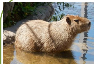
「くもざる・かびばら館」のカピバラは夏期のみ観覧可

旭山動物園での「芸術」と「変化」を見に来てくださいね。日本一早い紅葉が見られる、大雪山系・旭岳。今年の見ごろは、昨年にならぬ一週間早かったそうです。9/30には初冠雪が観測されました。そろそろ冬支度ですね。さて、そんな秋ですが、園内では、児童動物画コンクール受賞作品の展示会が11/3(祝)まで、11/1(水)からは動物読書感想文の募集が始まりました。動物読書の秋といった感じですね。動物たちは、羽や毛がはえ換わりはじめる、これからくる季節に備えますよ。夏期間開園は11/3(祝)まで。冬期間には観覧できない動物がいますので、今のうちに観覧をしに来てくださいね。