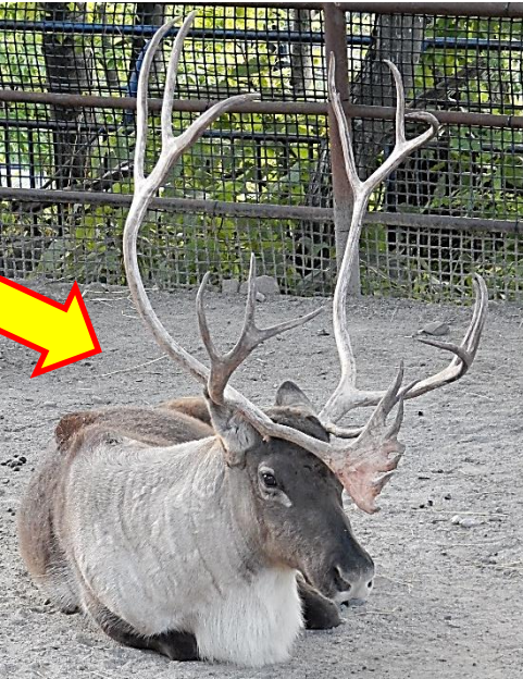
ツノを覆っていた皮がはがれ、白く立派なツノが完成しました。毛の色も白く変わり始めていますね(9/6)

トナカイのオスのツノは、繁殖期を終えた2月下旬に抜け落ち、そしてまた秋から冬の繁殖期に向けてツノが成長していきます(エゾシカのオスのツノも毎年、はえかわります)。今年も立派なツノができあがりました。ぜひ観察しにきてくださいね。