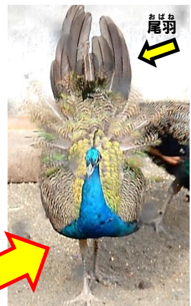
長い飾り羽は尾羽で持ち上げて広げていたのがわかります(9/21)