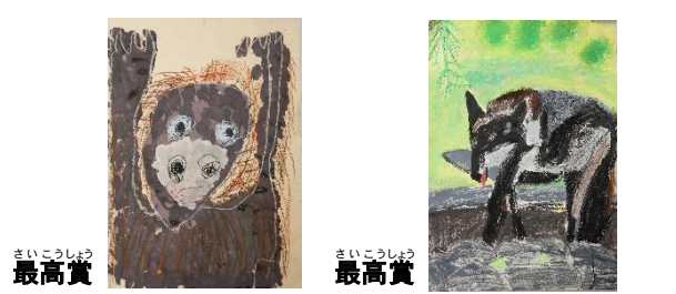
最高賞 旭川市長賞(幼児の部) 宮田 歳空さん 最高賞 旭川市長賞(低学年の部) 河合 琴子さん

6/1から8/25まで募集をしていた児童動物画コンクール。8/30に審査会があり158名の受賞者が決まりました。応募総数は1232点でした。また9/23にはコンクールの表彰式が行われ、学習ホールでの受賞作品展示がスタート。個性豊かな動物たちがいっぱいですよ!