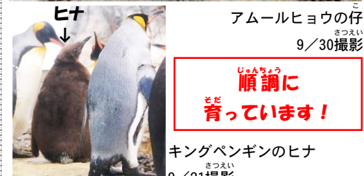
キングペンギンのヒナ 9/21撮影

7/11に孵化したキングペンギンのヒナ。フワフワの茶色い羽毛におおわれ、親と同じくらい大きくなっています。体重は8kg超(9/21)。親の体重は14~15kgなので、まだまだ大きくなりますね。8/12と13に生まれたアムールヒヨウの仔ですが、性別判定をしたところオスとメスでした。体重は共に2kg台後半(9/30)。放飼場デビューが楽しみです。