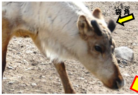
皮で覆われてた袋角がはえてきました(4/17)