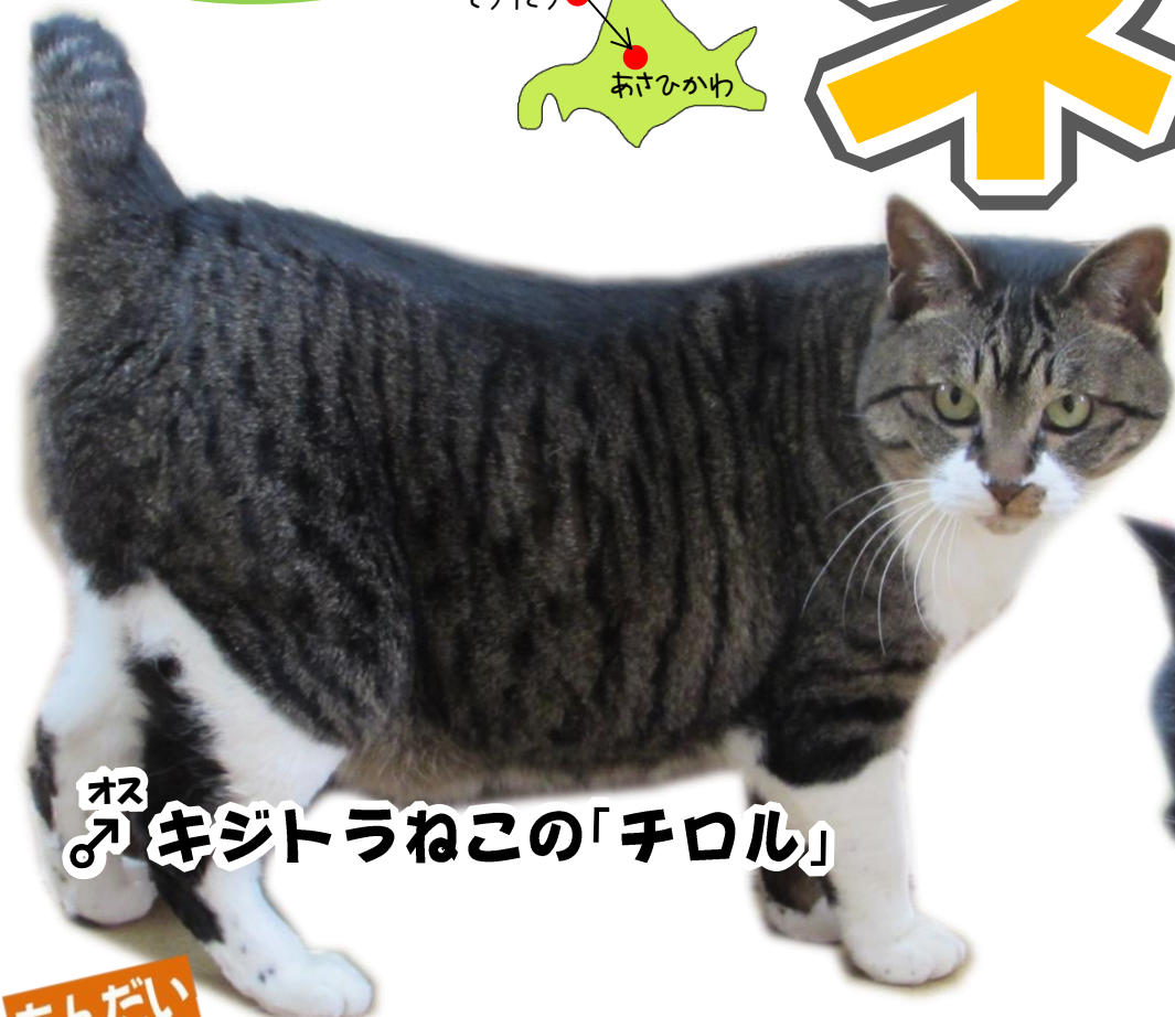
オス ♂ キジトラねこの「チロル」