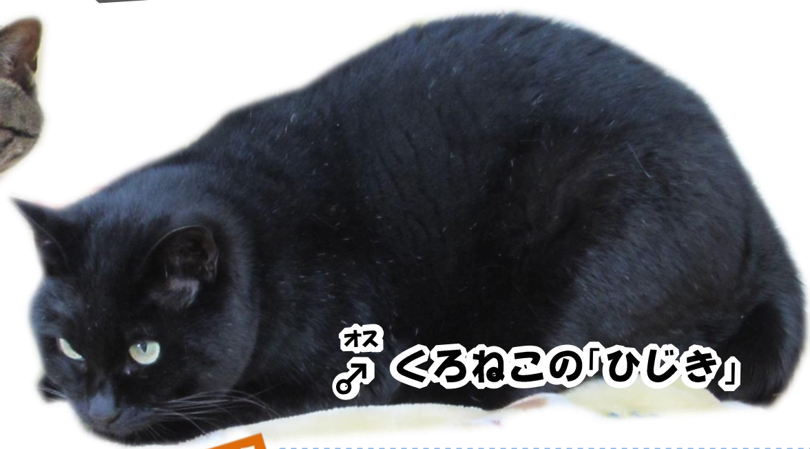
オス ♂ くるねこの「ひじき」

げんきいっぱい「チロル」と おっとり おとなしい「ひじき」 あさひやまどうぶつえんに きて もうすぐ 2ねんになるよ！ こどもぼくじょうにいる 2とうの げんきな すがたを みにきてね！