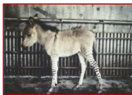
ロバの父、シマウマの母から生まれた動物(タテ13)