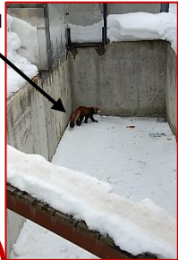
レッサーパンダが「〇〇」にいるところ(タテ19)