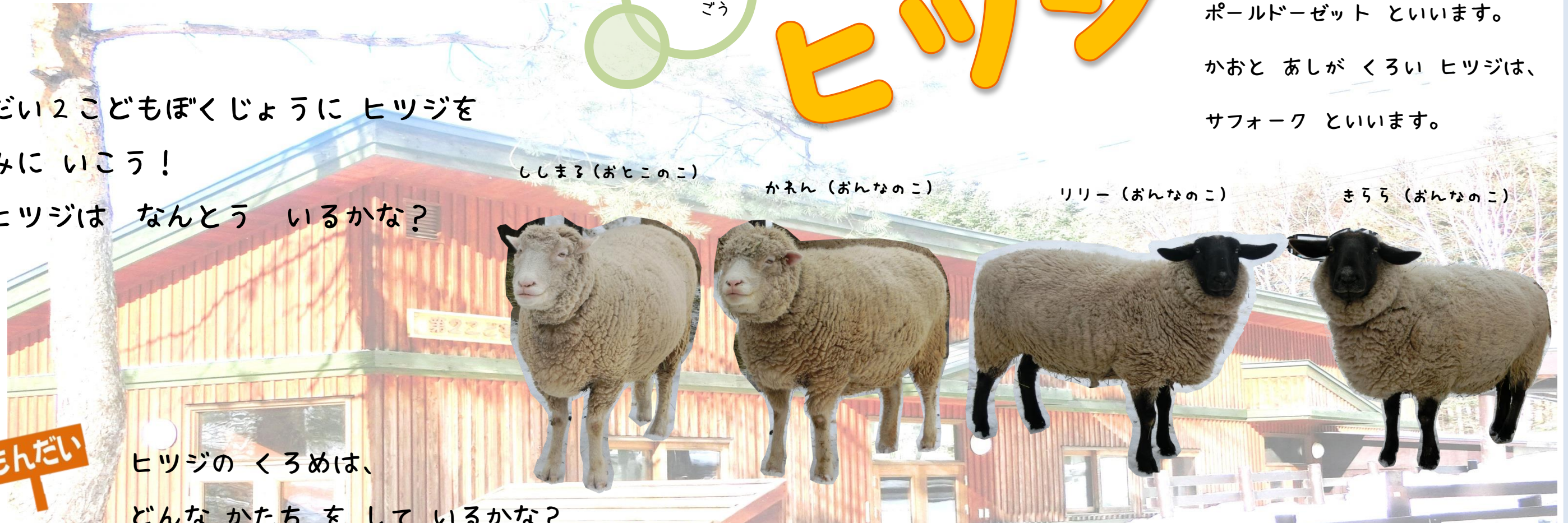
まろろ (おんなのこ)