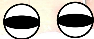
ひつじのほうしじょう