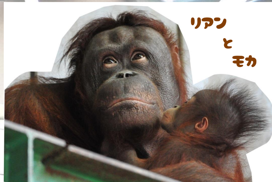
リアン と モカ

あさひやま どうぶつえん には おとうさんの 「ジャック」と おかあさんの 「リアン」、こどもの 「モルト」 (おとこのこ) と 2がつ に うまれた ばかり の 「モカ」 (おんなのこ) の 4とうの オランウータン が います。