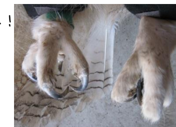
ワシミズクのおし

このおしは フワフワのうもうが はえているね！ ワシミズクのおしのゆびだよ。ワシミズクは ネズミや ノウサギを たべるから うもうがはえていてもつかまえらるんだね！