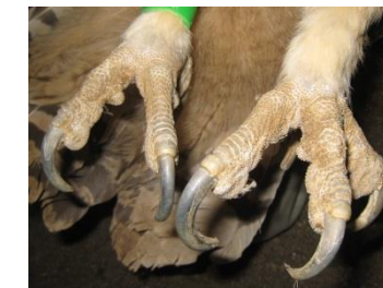
シマフクロウのおし

シマフクロウの だーいすきな さかなをつかまえやすいようになんだよ！ うもうがないから みずのなかでもつかまえやすいね。