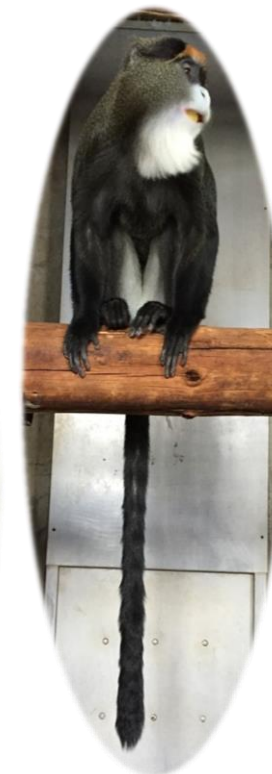
こんなに しっぽが ながいんだよ!