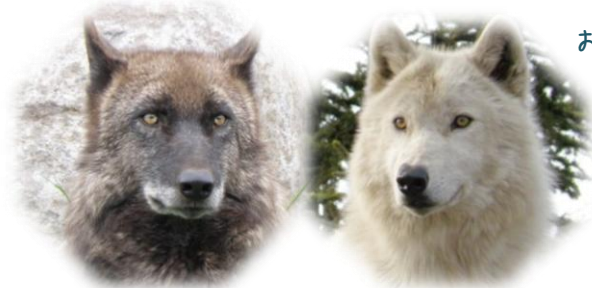
おとうさんの ケン

オオカミの もりで シンリンオオカミの こどもが かけまわって あそんでいるよ。 5がつに うまれてから どのくらい おおきく なったのかな? どうぶつえんに あいにいこう!