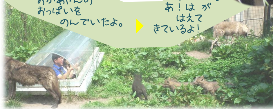
おきやくさんの ちかくまで あきびにきたよ