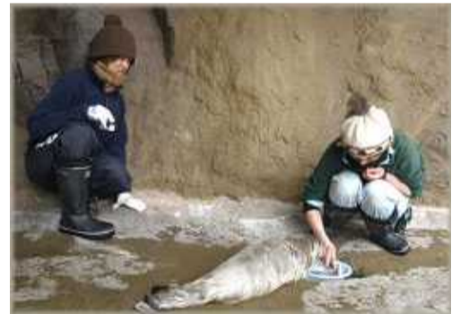
元気にプールで泳ぎ、陸に上がったところで、餌の時間です。「ホッケ」という魚を与えています。