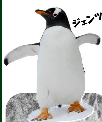
ジェンツーペンギン