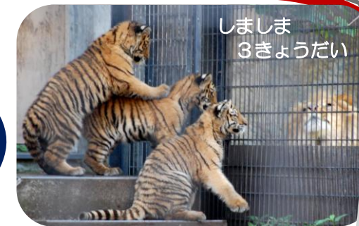
しましま 3きょうだい