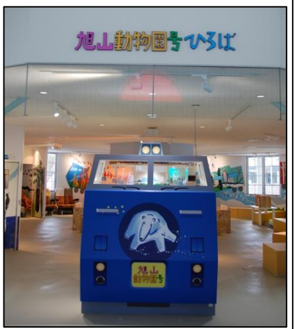
運転席の窓に顔をはめて撮影できます