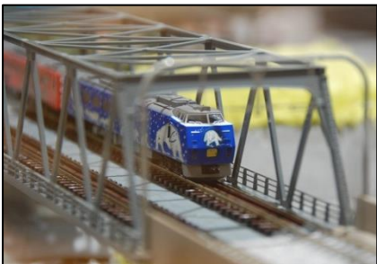
列車が走るジオラマもあります

「旭山動物園号ひろば」内には、実際に列車内で使われていたシートや、「ハグハグチェア」のほか、旭山動物園号が走るジオラマ、キッズスペースなど、旭山動物園号の雰囲気がいっぱい!館内の壁には旭山動物園号のラッピングデザインと同じ、元旭山動物園の飼育展示係で現在絵本作家のあべ弘士さんの絵が描かれています。