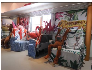
「ハグハグチェア」で記念撮影!