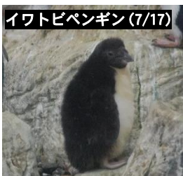
イワトビペンギン(7/17)