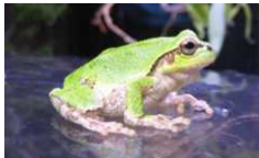
1のヨコ このカエルの名前が答えだよ