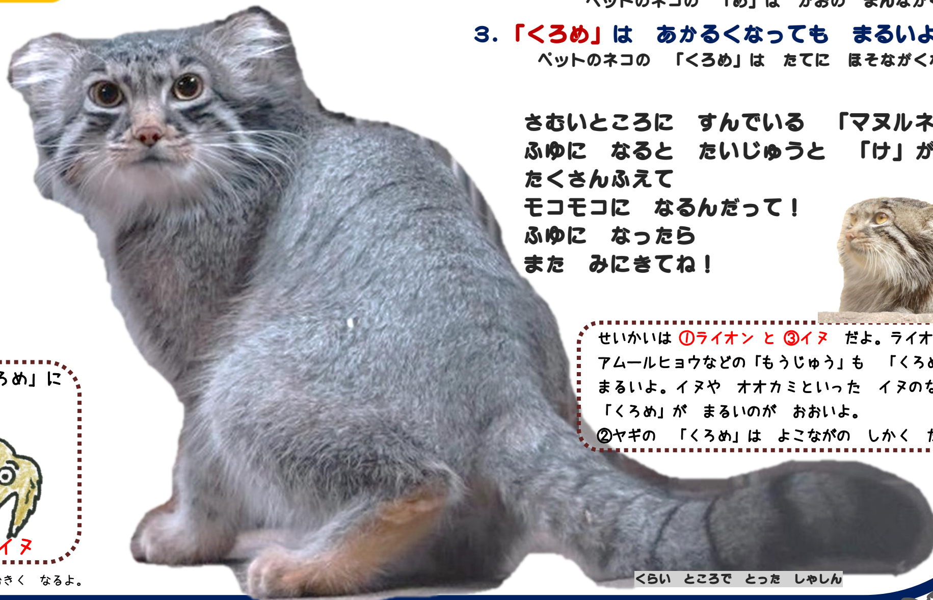
くらいところでとったしゃしん