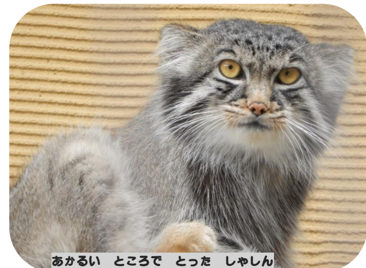
あかるいところでとったしゃしん