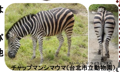
チャップマンシマウマ(台北市立動物園)

こたえは②。シマウマのはしま模様は 首から背中にかけては上から下に、 腰からおしりにかけては左右にのび ているよ。肢のしま模様も左右、地 面と平行にのびているね。