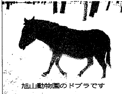
旭山動物園のドブラです