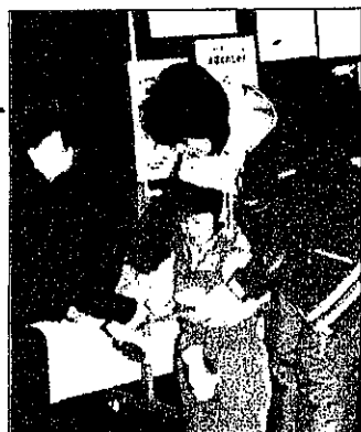
連続出席者表彰のようすです

今年から、十一月も読み聞かせをすことになりました。 十月の参加者・・・68人 十一月の参加者・・・53人 一月の参加者・・・42人 ☆三月の参加者・・・人 三月は、みなさんも、ぜひ、参加してください。