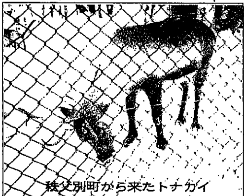
秋分別町から来たトナカイ

皆さん冬の動物園に何回くらい来てみましたか。今年、三年目を迎え、動物たちも冬の大勢のお客さんに慣れたよう