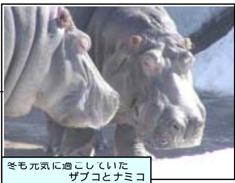
冬も元気に過ごしていたザブコとナミコ

食べ物 =主に夜間、陸上の開けた草原で、丈の低い数種のイネ科の草本だけを大きな口で引き抜くようにして食べます。