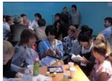
北方四島への訪問 (国後島での青少年住民交流)

北方領土問題が解決されるまでの間、相互理解の増進を図り、領土問題の解決に寄与することを目的として行われている旅券・査証なしによる日本国民と北方四島在住ロシア人との相互訪問事業で、1992年から事業実施団体が実施しています。