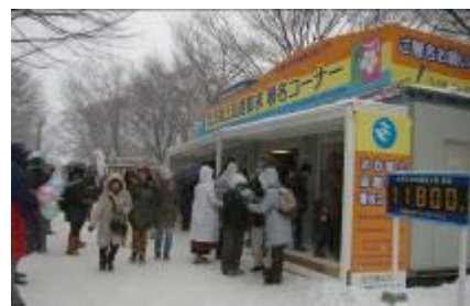
さっぽろ雪まつり会場での署名活動

また、1965年から始められた「北方領土返還要求署名」については、全国各地の関係団体などが積極的に署名活動に取り組んでおり、2021年3月時点での総署名数は9,200万人を越えています。