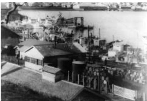
戦前の北方領土の様子（国後島・賑やかな頃の高釜布市街と湾）