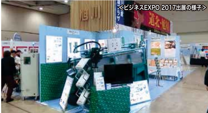
＜ビジネスEXPO 2017出展の様子＞