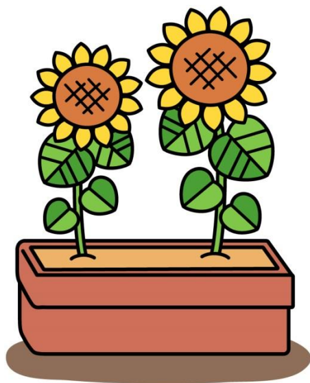
子育て支援部愛育センター