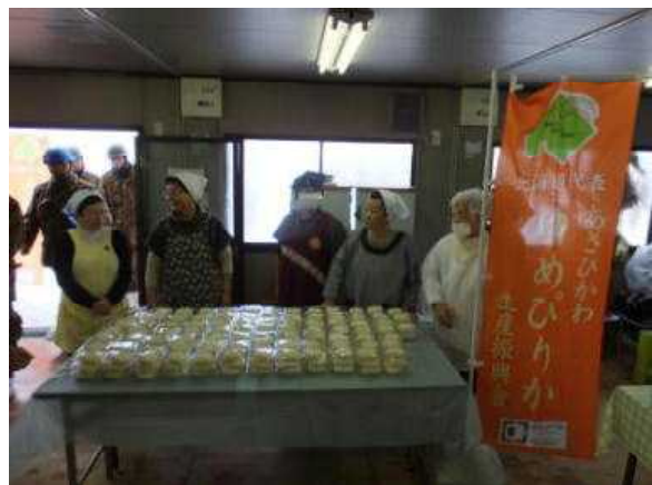
旭川冬まつり激励慰問