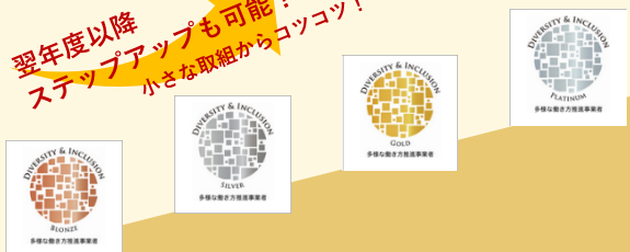
ブロンズ認定 シルバー認定 ゴールド認定 プラチナ認定