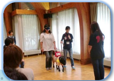
盲導犬ゆずちゃんに