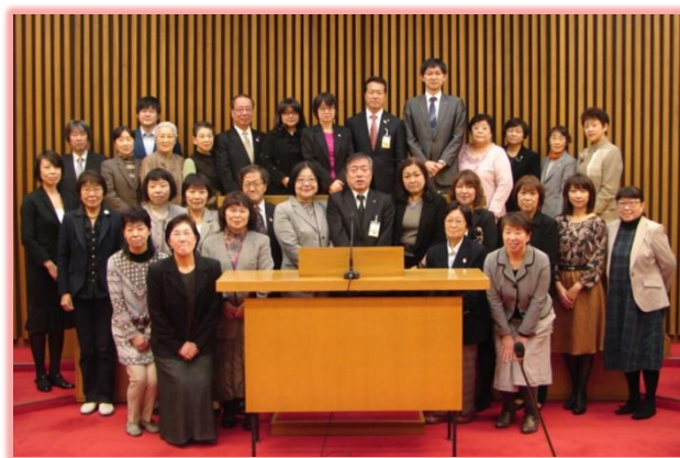
実行委員会メンバー 市長・教育長・副市長を囲んで(議場にて)