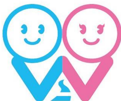
あさひかわ男女共同参画シンボルマーク