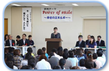
開会式（母親委員長の挨拶）

旭川市PTA連合会事務局 旭川市6条通5丁目 日章小学校3階 TEL:0166-23-2916 FAX:0166-23-2917 メール:kyokupta@sea.plala.or.jp