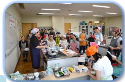
毎回好評のクッキング分科会