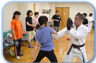
身体を使って護身術の体験