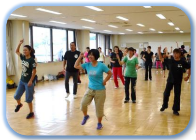
汗だくになったダンスエクササイズ