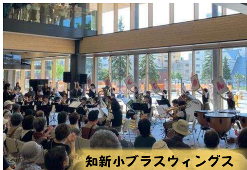
知新小ブラスウィングス