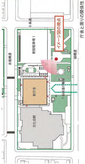
庁舎と周りの関係性