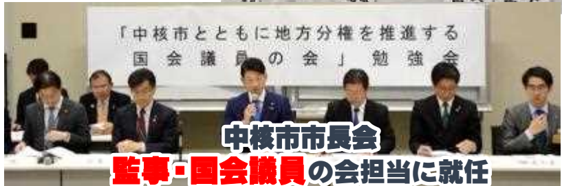
中核市市長会 監事・国会議員 の会担当に就任