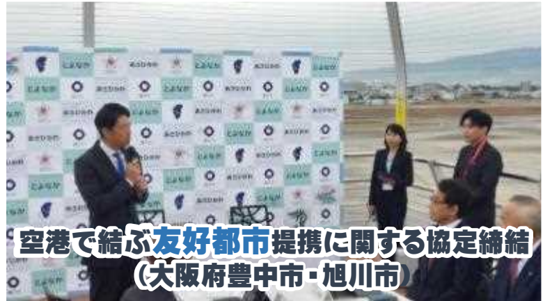
空港で結ぶ 友好都市 提携に関する協定締結 (大阪府豊中市・旭川市)