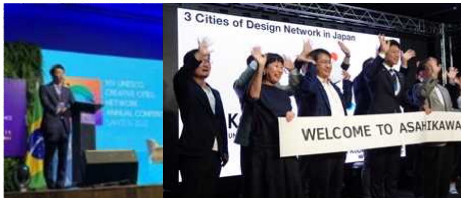
デザイン分野加盟49都市