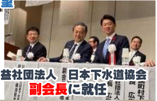
公益社団法人 日本下水道協会 副会長 に就任