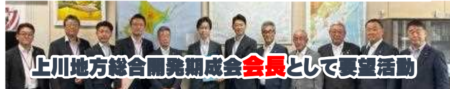
上川地方総合開発期成会 会長 として 要望活動