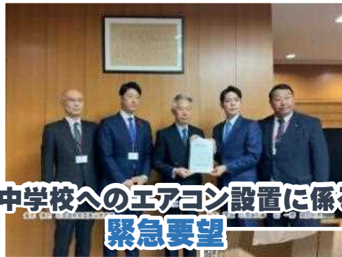
小中学校へのエアコン設置に係る 緊急要望