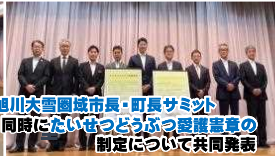
旭川大雪圏域市長・町長サミット 同時に たいせつどうぶつ愛護憲章の 制定について 共同発表