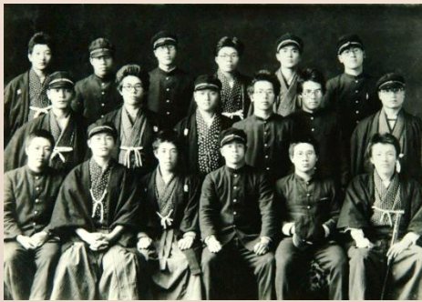
昭和4(1929)年 四高柔道部主将となる