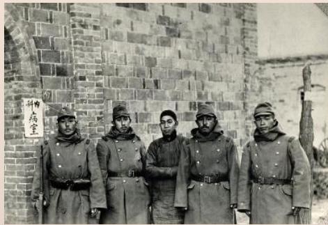
昭和12(1937)年 名古屋砲兵第三聯隊に応召 石家荘の野戦予備病院に収容