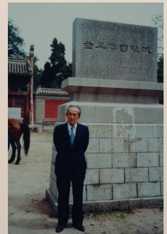
昭和63(1988)年 曲阜魯国故城遺跡碑の前