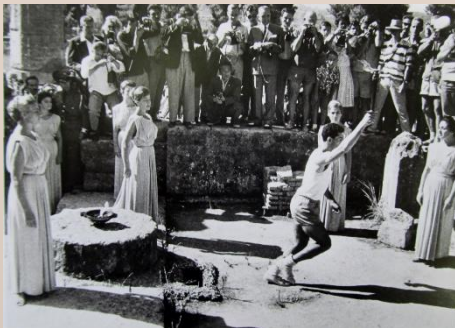
昭和35(1960)年 ギリシャで聖火を取材 (ローマオリンピック)