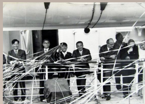
昭和40(1965)年5月 横浜港 バイカル号でソ連へ