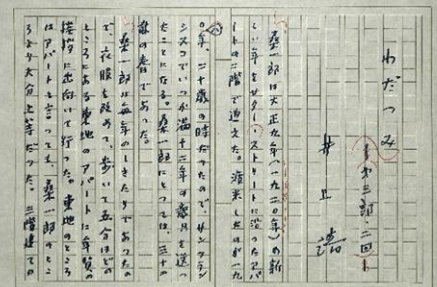
未完の長編「わだつみ」の原稿