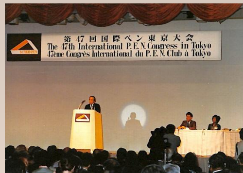
昭和59(1984)年 第47回国際ペンクラブ東京大会で挨拶