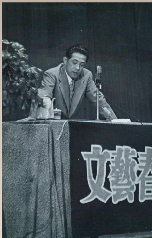
昭和30(1955)年 旭川 文藝春秋文化講演会