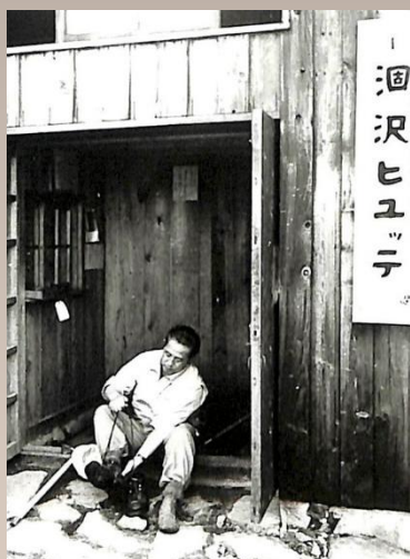
穂高 酒沢ヒュッテ 「氷壁」の舞台にて

昭和元年（1926年）から起算して満100年を迎える令和8年（2026年）。内閣官房「昭和100年」関連施策推進室の昭和百年事業に共同し、井上靖の愛蔵品を中心として、写真や作品から井上靖の足跡が『昭和』と重なることを展示します。