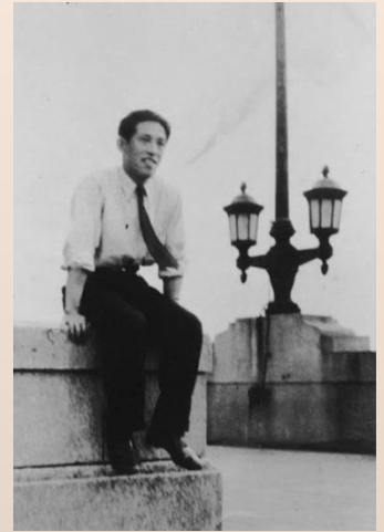
大阪毎日新聞社時代