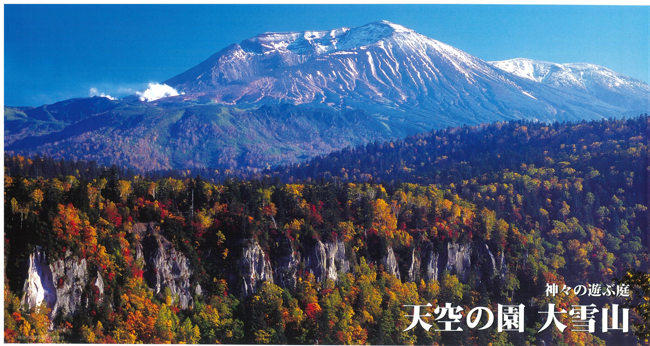
峡谷の紅葉と絶壁した旭岳