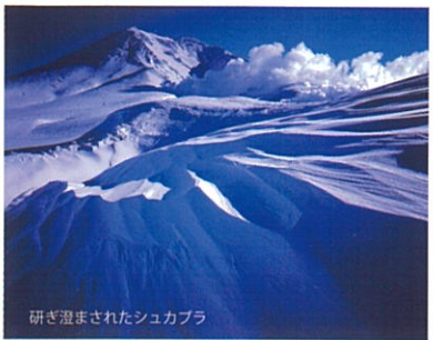
研ぎ澄まされたシュカブラ