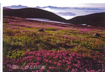
一面に広がるお花畑