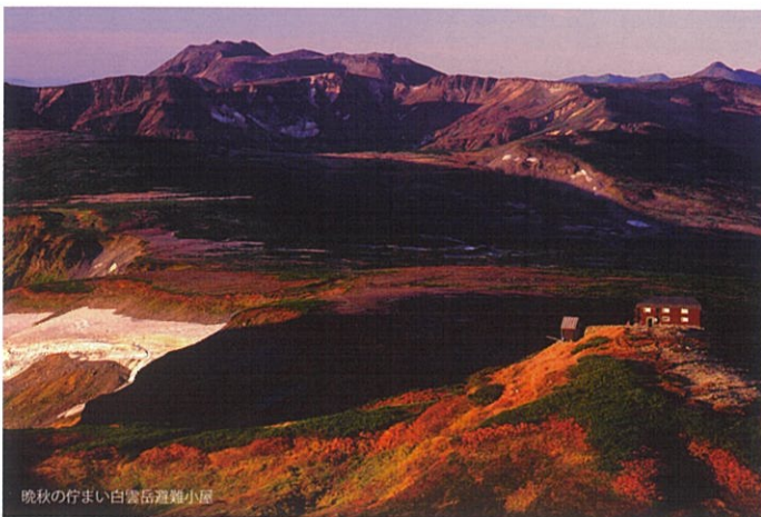
晩秋の佇まい 白雲岳避難小屋