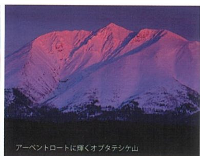
アーベントロートに輝くオプタテシケ山