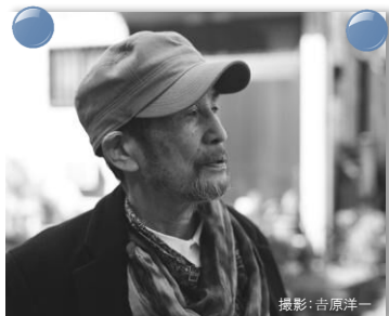
審査員長：吉増剛造 詩人・文化功労者・日本芸術院会員