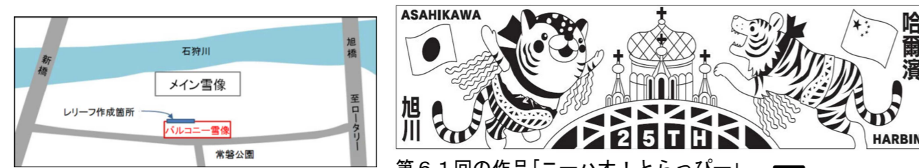
第61回作品「ニーハオ!とらっぴー」

バルコニー雪像正面右側の高さ約4m×幅約18mの部分のデザイン案。下の写真部分に制作します。