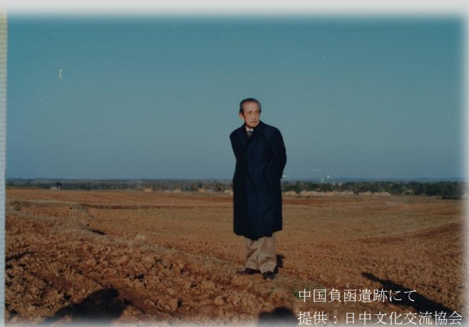
中国負函遺跡にて