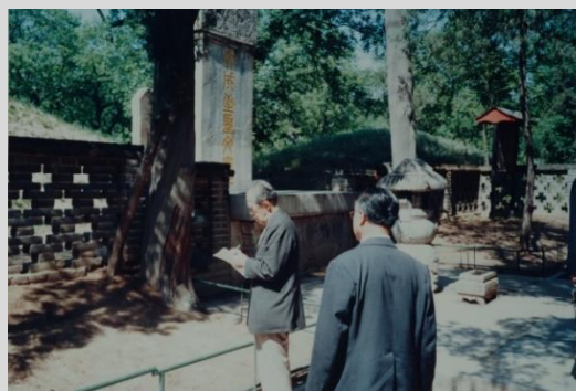
孔子生誕の地、中国曲阜にて

企画展では、取材ノートと取材旅行の記録及び関連する場面を展示し、最後の長篇「孔子」に託した井上の思いに迫ります。