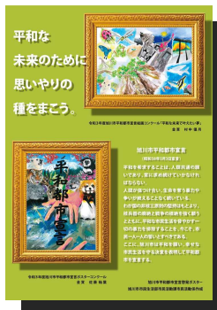
令和3年度平和都市 宣言啓発ポスター