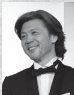
くま かわ てつ や 熊川 哲也 氏