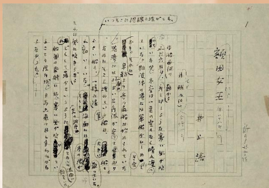
近江の旅より「額田女王」原稿

本展では、井上靖の日本の旅を「旭川」、「東北」、「甲斐・信濃」、「近江」、「紀州」、「山陰」の6つの地域に分け、旅の様子や旅から生まれた作品を紹介する。