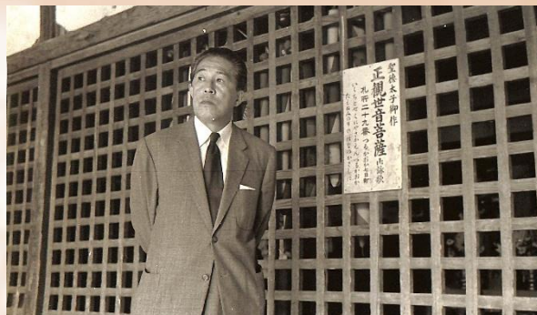
東北の旅より 出羽三山・羽黒山(昭和35年)