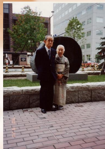
最後の旅 旭川信金前(平成2年)