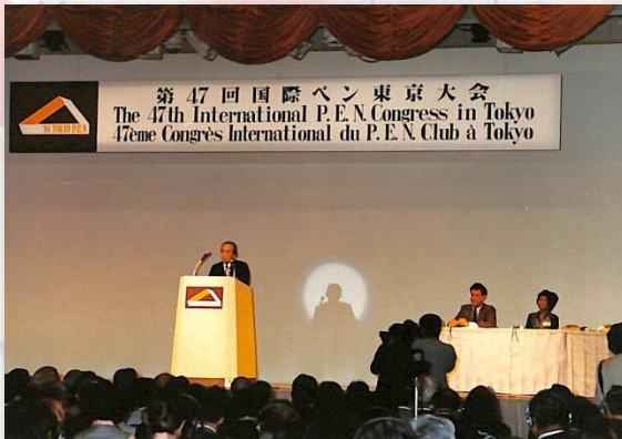
国際ペン東京大会でスピーチをする井上靖(昭和 59 年 5 月)

日 時: 令和2年2月22日(土) 13時30分～15時 場 所: 井上靖記念館ラウンジ 内 容: 企画展担当職員による展示解説 入館料: 無 料 定 員: 30 名 申 込: 電話またはFAXでお申込みください