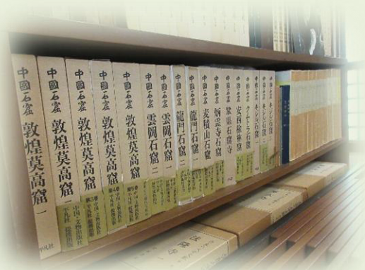
旧井上靖邸 応接間 書棚