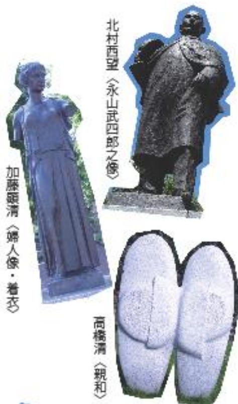
加藤頭清<婦人像・着衣>